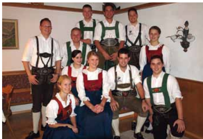
Der neue Vorstand der Jungbauern