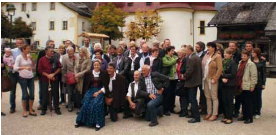
Kompanieausflug an den Königssee