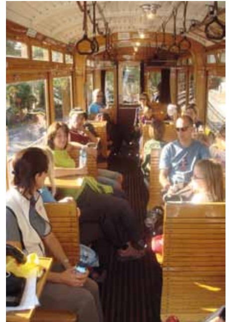
Fahrt mit dem Nostalgiezug der Tiroler Museumsbahnen

Am Sonntag fuhren dann um 9:30 Uhr 13 Kinder und 28 Erwachsene mit einer alten Straßenbahngarnitur der Tiroler Museumsbahnen von der Remise in Wilten nach Fulpmes ins Stubaital. Die Fahrt, welche bei wunderschönem Wetter stattfand, wurde zu einem tollen Erlebnis für die Kinder, und auch die Erwachsenen genossen die Fahrt und erzählten von ihren Kindheitserlebnissen mit dieser Bahn.