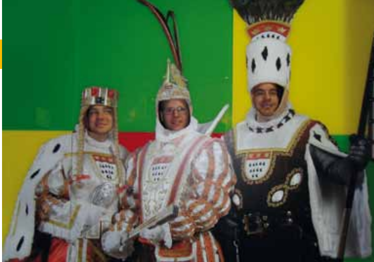
Besuch im Karnevalmuseum Köln

Die Idee entstand vor drei Jahren, als sich fünf Amraser Matschgerer dieses Spektakel schon einmal anschauten. Ausgeschrieben vor zwei Jahren und gebucht vor einem Jahr, so war es nun endlich soweit. Und das harte Warten hat sich gelohnt. Die Amraser Matschgerer machten sich zu einem Event der Superlative auf: Zum Faschingsauftakt am 11.11.11 in die Heimat des Karnevals, nach Köln.