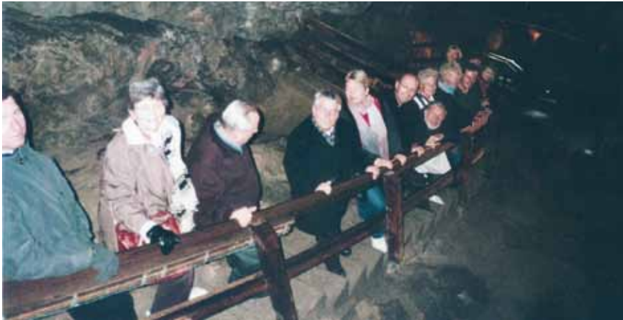
... in der Lamprechtshöhle

Die Arbeit des Kirchenchores wird nicht nach dem Jahreskalender organisiert, sondern nach den kirchlichen Festen. „Jahresabschluss“ ist für den Amraser Kirchenchor die Aufführung beim Patrozinium am 15. August. Dann gilt es, die Planung für das nächste Chor-Jahr zu erstellen. Diese Aufgabe haben Chor-Obfrau, Chorleiter und Chor-Organist wahrgenommen und ein Jahresprogramm vorgeschlagen, das dem Chor hohen Einsatz abverlangen wird. Aber so soll es ja sein, denn es gilt das alte Gesetz: „Ohne Fleiß kein Preis!“