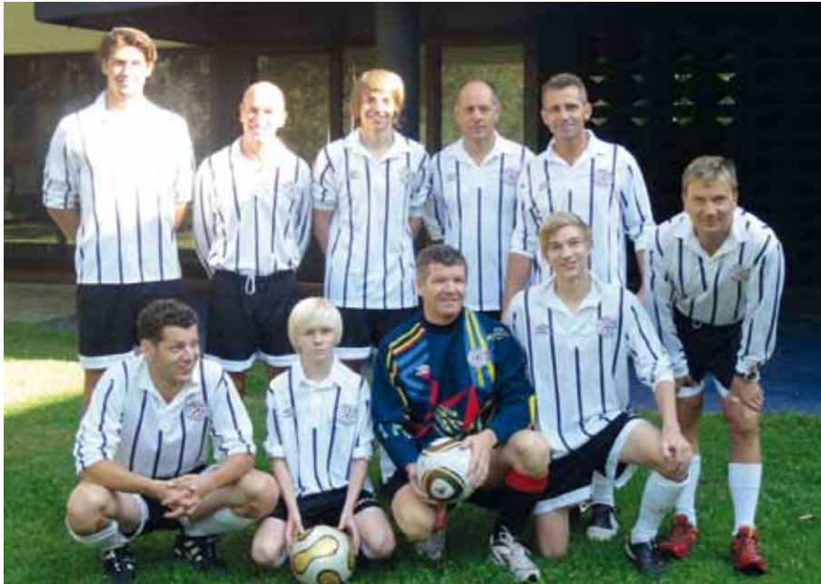
Die erfolgreiche Mannschaft des SCA

Dass 65. jährige Jubiläum des Trachtenverein die Amraser war der Anlass für die Wiederbelebung des Amraser Dorffußballturniers am 3. September in Egerdach. An diesem Kleinfeldturnier beteiligte sich der SCA mit einer Mannschaft. Und die Spieler des SCA legten einen fulminanten Start hin. Durch unseren Trainer Dieter Mayer hervorragend gecoacht wurde das erste Spiel klar mit 7:0 gewonnen. Beim zweiten Spiel gegen die Matschgerer erreichten wir ein 0:0. Die 3 nächsten Partien konnten wir wieder gewinnen und zwar 11:0, 2:1 und 1:0. Mit vier Siegen und einem Unentschieden, sowie einem Torverhältnis von 21:1 erreichten wir den ersten Platz und sind damit Amraser Dorfmeister 2011! Ein großes Lob und Dankeschön gebührt den Mitarbeitern des Trachtenverein die Amraser, welche dieses Turnier super organisiert und durchgeführt haben. Sollte es nächstes Jahr wieder ein Fußballturnier geben, dann wird sich der SCA sicher wieder daran beteiligen.