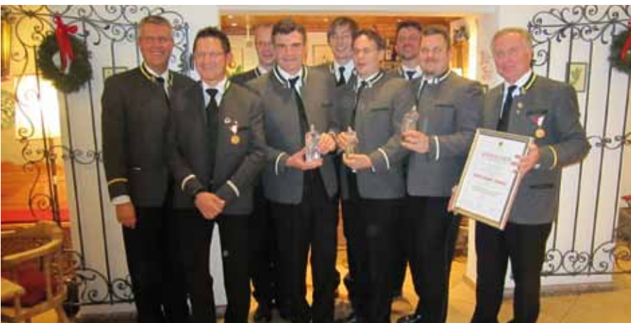
Ehrung von verdienten Musikanten bei der Cäcilienfeier

Bläsergruppe konnte die Musikkapelle Amras ihre Wertschätzung gegenüber dem Trachtenverein „Die Amraser“ zum Ausdruck bringen und gleichzeitig zu ihrem 65-jährigem Bestandsjubiläum gratulieren.