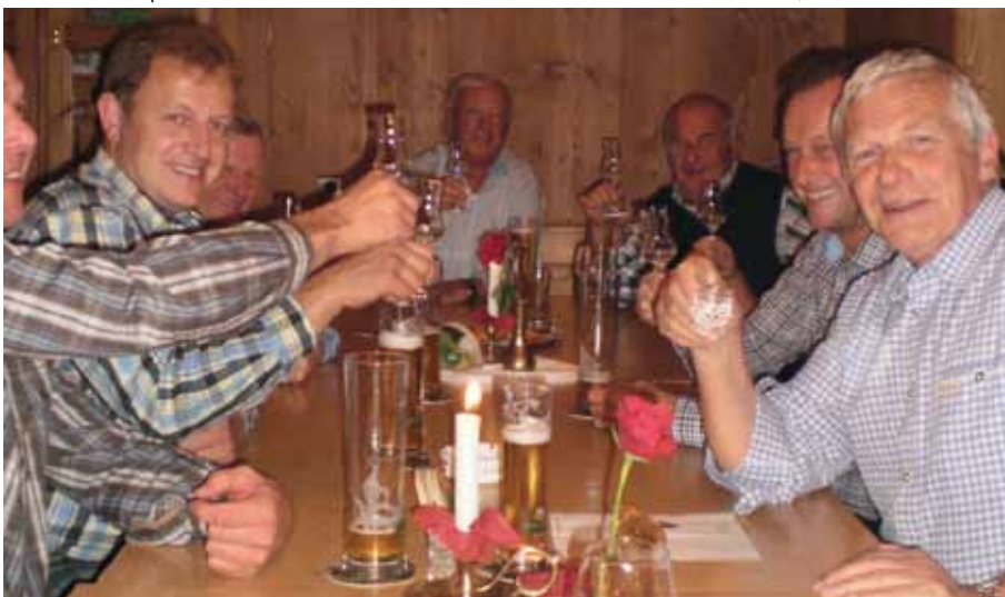
Törggeleausflug in Navis