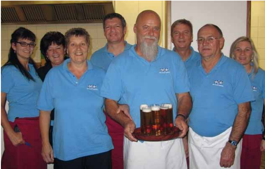
Bedienservice am Jubiläumsabend durch den Schiclub Amras

Wuzeln, Watten oder auch Fußball teil. Der ein oder andere ist dann dazu zu bewegen, auch als Trachtenträger mitzuhelfen. Hier möchten wir noch stärker aktiv werden. Es wäre teilweise eine große Entlastung für die Aktiven, wenn hier bei Ausrückungen von Fahnenabordnungen oder auch bei Trachtenfesten noch mehr Trachtenträger ausrücken könnten.