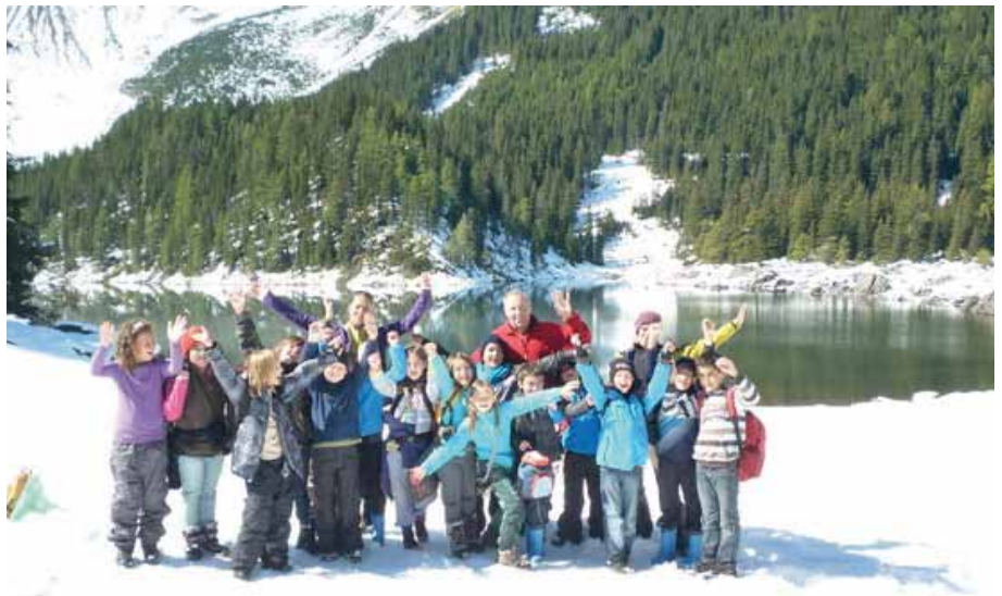
Naturerlebnistage in Obernberg bei 40cm (!) Neuschnee