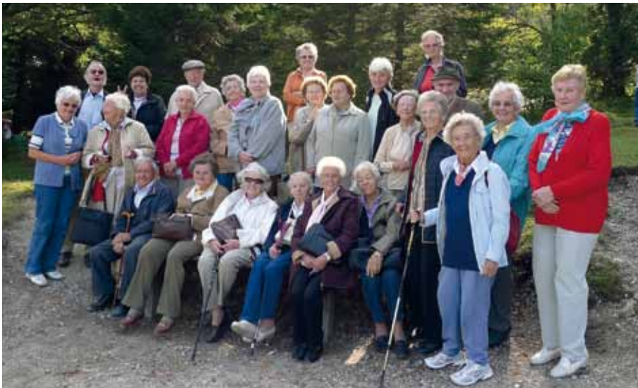
Ausflug zum Achensee