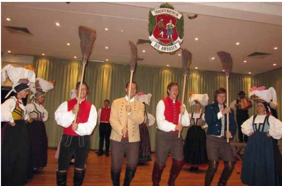
Auftritt der Volkstanzgruppe aus Slowenien