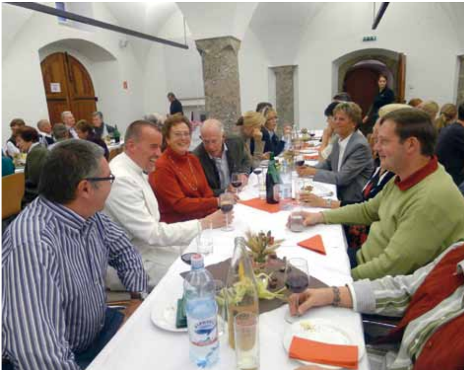
Mitarbeiter der Pfarre Amras beim Bedankfest

die vom Trachtenverein betreute Kapelle getragen. Nur der „Josef“ bleibt in der Kirche – er ist zu groß für die Kapelle. Dazwischen klingen die Zurufe des Registrars vor dem Kapelleneingang: „Passt's auf dem Himmel auf!“ oder „In die Knie, sonst haut's der Maria den Kopf ab!“ Zum Schluss kommen die Blumenstöcke in die Schalen an den Fergeln – es soll ja alles schön und feierlich sein.