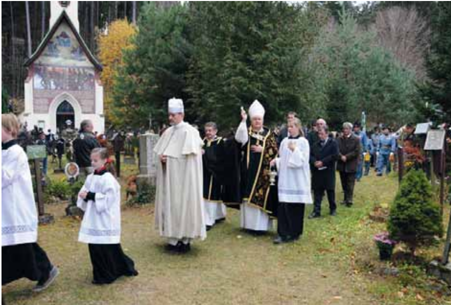
Seelenfeier am Tummelplatz