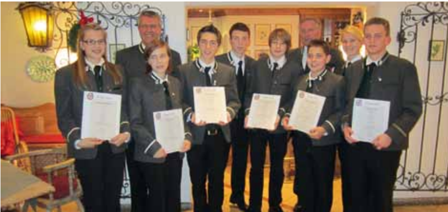
Überreichung der Jungmusikerleistungsabzeichen in Gold, Silber und Bronze