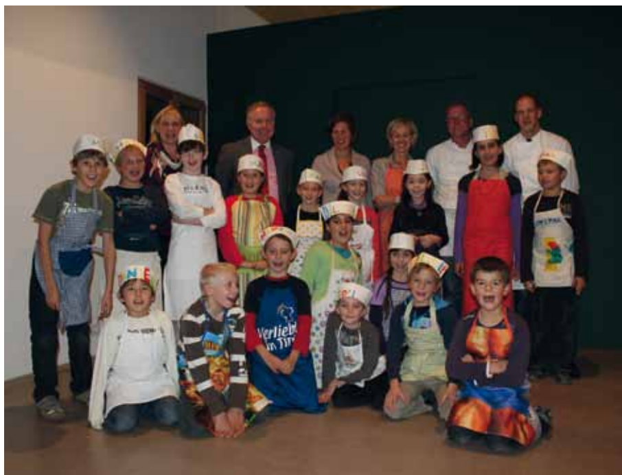
Kinder der 3b Klasse kochen für die Tiroler Hospizgemeinschaft

Deshalb messen wir heuer speziell dem Erlesen bzw. Vorlesen eine besondere Gewichtung bei. Mehrere Aktivitäten sind dazu geplant: Nutzung unserer hervorragend bestückten und aktiven Schulbibliothek, Lesepartnerschaften mit größeren Kindern, Begegnung mit interessanten Autoren und Leseaktivitäten in der Schule und Öffentlichkeit unter Einbindung von Eltern und Großeltern. Außerdem ist die Bewerbung an einer tirolweiten Zertifizierung für das Gütesiegel >Leseschule< geplant.